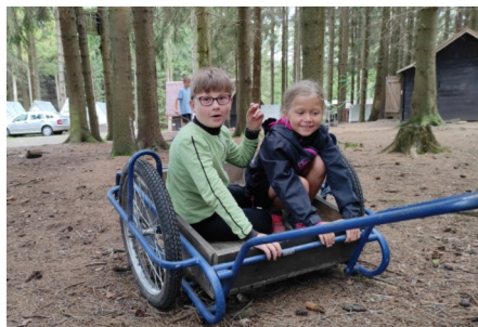
Za organizátory Lukáš Sourada